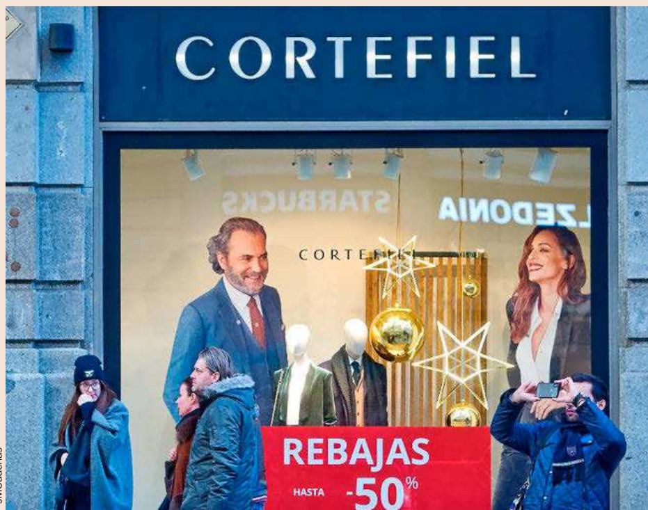
Cadenas como Cortefiel iniciaron ayer la campaña de rebajas de invierno.