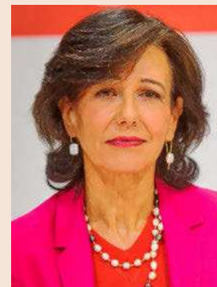
Ana Botín, presidenta de Santander.

Santander estudiará cualquier operación si "encaja" en su estrategia y en su criterio financiero, según reconoce Ana Botín a Financial Times . Los grandes banqueros ponen su objetivo en la consolidación ante el estrechamiento de los márgenes. Bajo esta filosofía, Santander compró Popular, estrategia que Ana Botín califica de "beneficiosa". Santander, BNP y UniCredit son los potenciales actores en la consolidación. P10